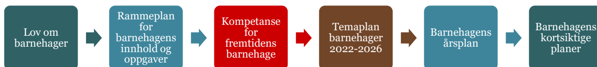
Figur 1: Planhierarki

Årsplanen er et arbeidsredskap for personalet og dokumenterer barnehagens valg og begrunnelser. Årsplanen kan også gi informasjon om barnehagens pedagogiske arbeid til myndighetsnivåene, barnehagens samarbeidspartnere og andre interesserte.