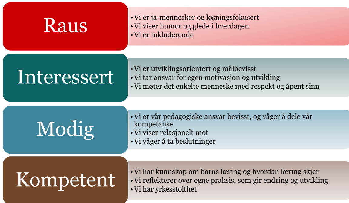
Figur 2: Oversikt over hva kommunens verdier betyr for barnehagens ansatte.